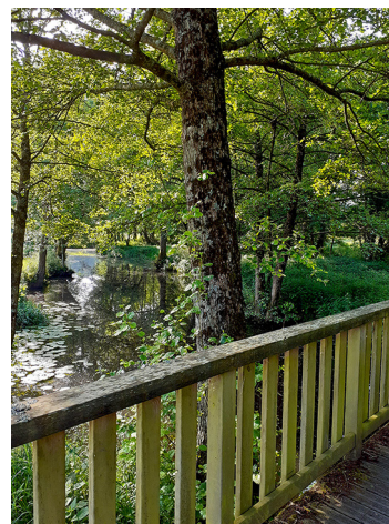
Passerelle sur la Boulogne