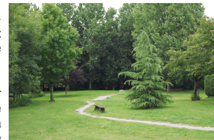
Parc de l'Ouche de la Boulogne

6 Arrivé sur la rue Georges Clemenceau, prendre à droite et aussitôt à gauche la rue Rabelais qui vous ramène au point de départ.