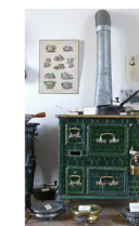
Musée des ustensiles de cuisine

• FFRandonnée Vendée : 02 51 44 27 38, vendee@ffrandonnee.fr , https://vendee.ffrandonnee.fr .